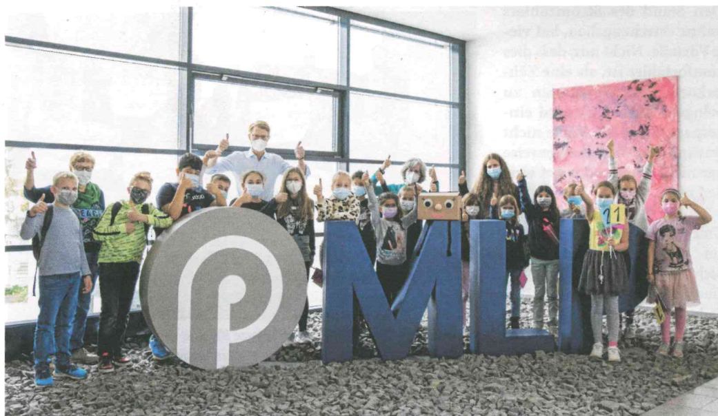
Den Kindern hat der Tag gefallen

Wie wichtig es ist, dass Erwachsene den Kindern regelmäßig vorlesen, kann man in vielen Forschungsberichten immer wieder nachlesen. Kinder entwickeln dadurch einen größeren Sprachschatz und lernen selbst leichter lesen. Da wiegt es umso schwerer, dass laut einer repräsentativen Umfrage der „Stiftung Lesen“, ein Drittel aller