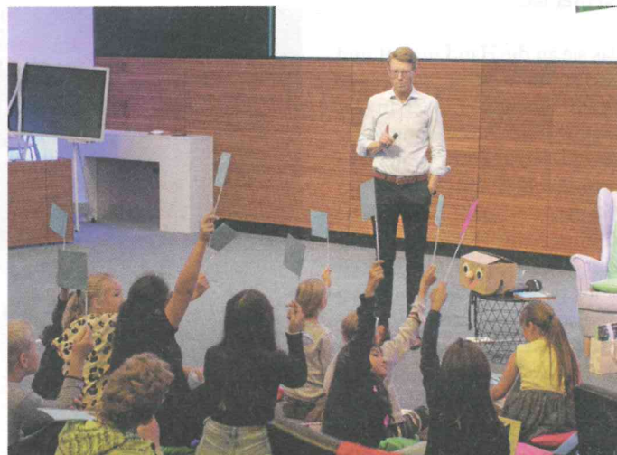
Wer am Ende das richtige Fähnchen mit der entsprechenden Nummer nach oben hielt, konnte ein Buchpaket gewinnen.